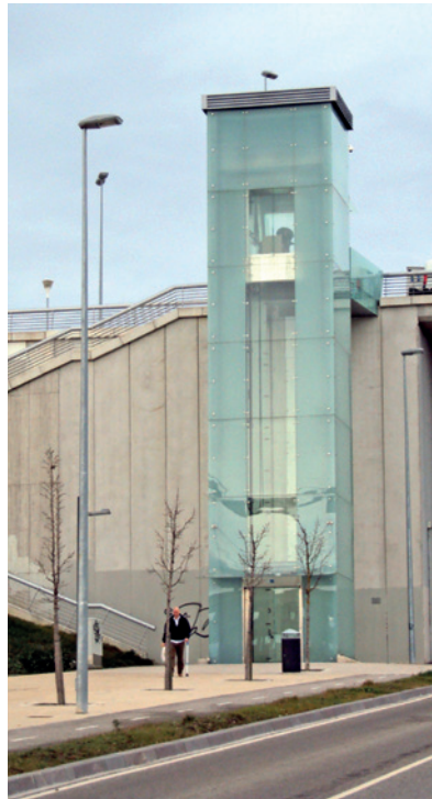
Ascensor panorámico de Lezkairu, Pamplona