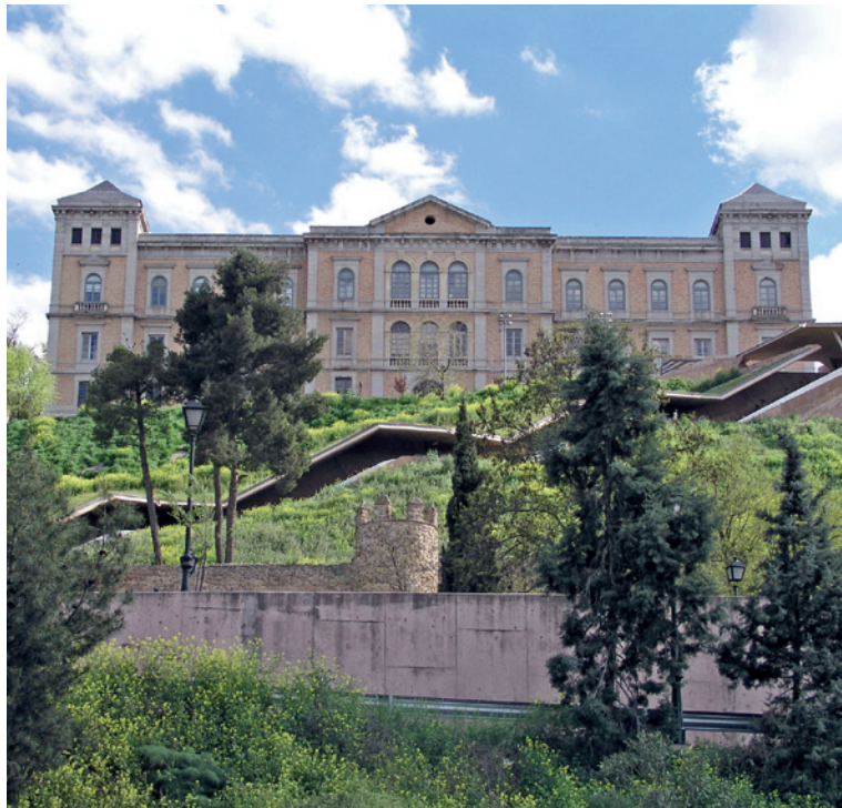
Subida a Toledo