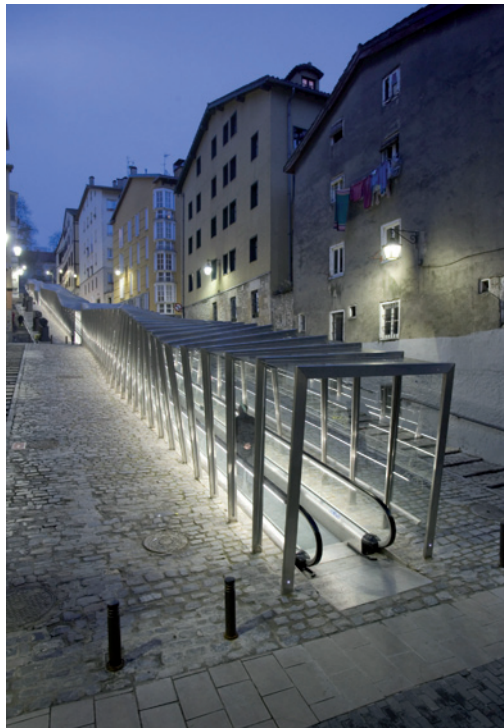
Pasillo rodante en Vitoria