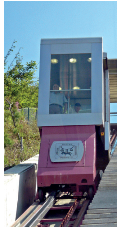
Funicular de Getxo