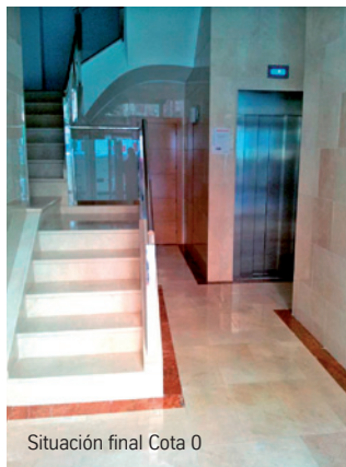
Situación final Cota 0