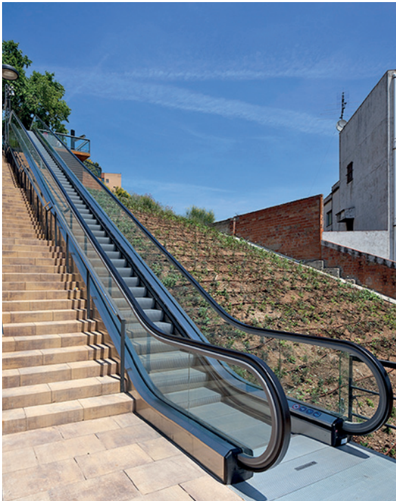
Escaleras mecánicas en Santa Coloma de Gramanet, Barcelona

Los espacios públicos accesibles, cómodos, bellos y seguros son una prioridad en los planes de urbanismo modernos. ThyssenKrupp Elevadores proyecta y desarrolla soluciones que permitan la movilidad eficaz para todas las personas, creando infraestructuras integradas en el entorno y minimizando el impacto medioambiental.