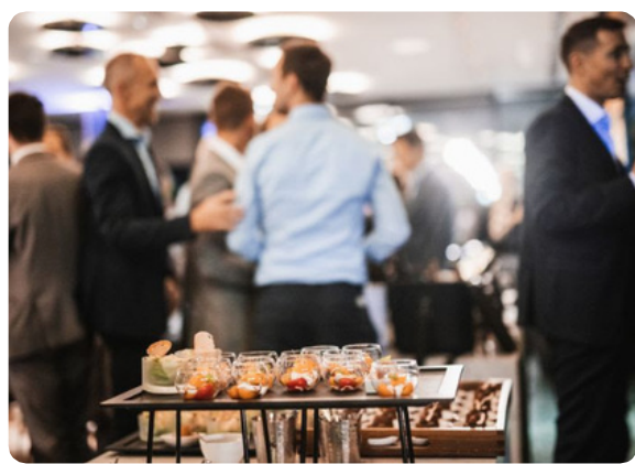
Cena y cóctel de clausura