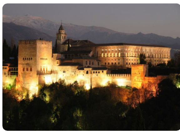
Visita nocturna privada a la Alhambra