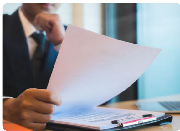
Documentación de las Jornadas

Y para los acompañantes también incluye visitas a la Catedral, Capilla Real y Monasterio de San Jerónimo. ¡Un programa cultural completo!