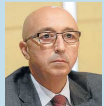
JAVIER CABEZA DE VACA “La pandemia ha convertido a la digitalización de las gestiones en una verdadera necesidad”