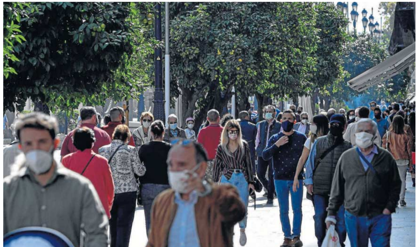
► Ciudadanos pasean tras el confinamiento. Abajo, sanitarios durante la pandemia.

Durante la pandemia del Coronavirus y sobre todo, durante los meses de confinamiento domiciliario, las recomendaciones e indicaciones de los colegios profesionales fueron cruciales para la puesta en práctica de la actividad laboral de los diferentes sectores profesionales. Si las corporaciones colegiales no tuvieran cabida en la sociedad, muchos derechos de los trabajadores se habrían perdido y diversas cuestiones laborales que afectan directamente a la práctica de la profesión no se habrían tomado en cuenta. Proteger la labor de sus representados es una de sus funciones que, sin duda, du-