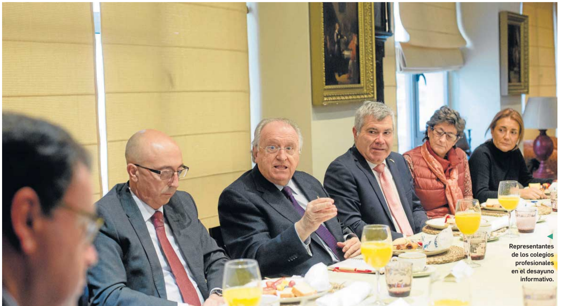
Representantes de los colegios profesionales en el desayuno informativo.