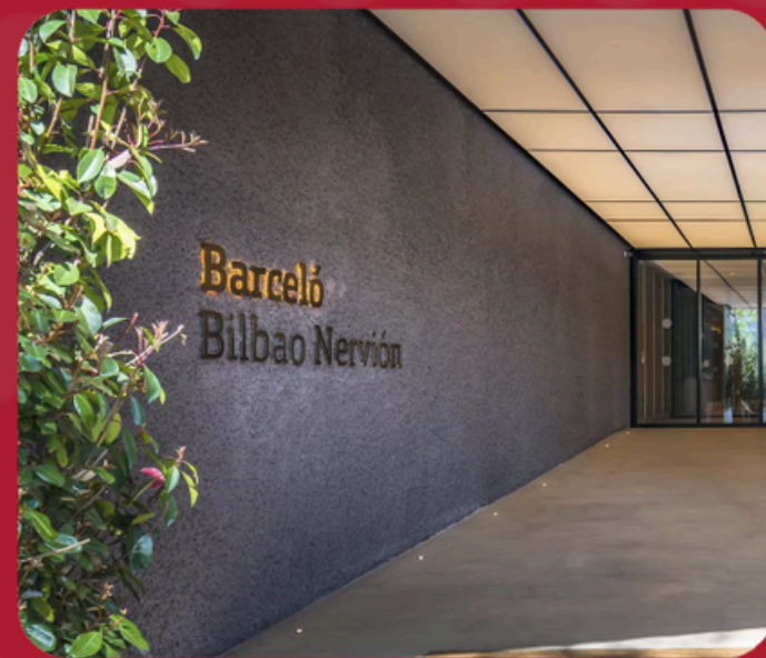
HOTEL BARCELO NERVIÓN