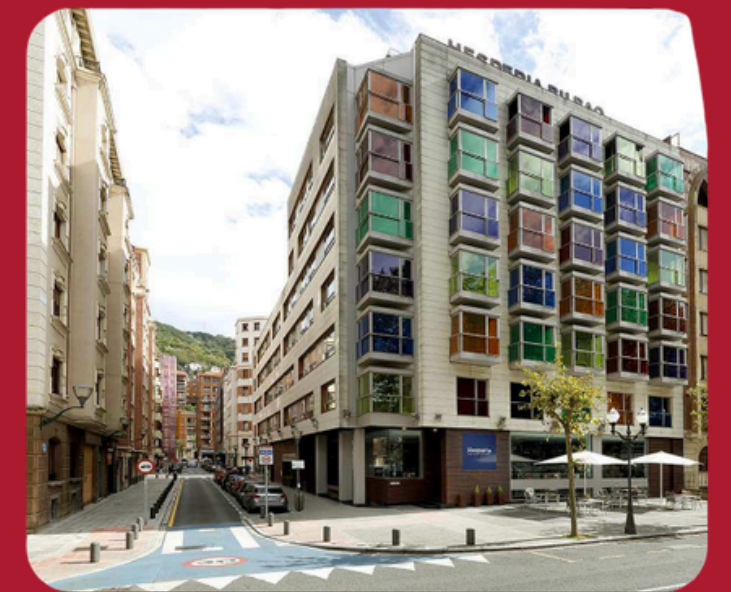
HOTEL HESPERIA BILBAO