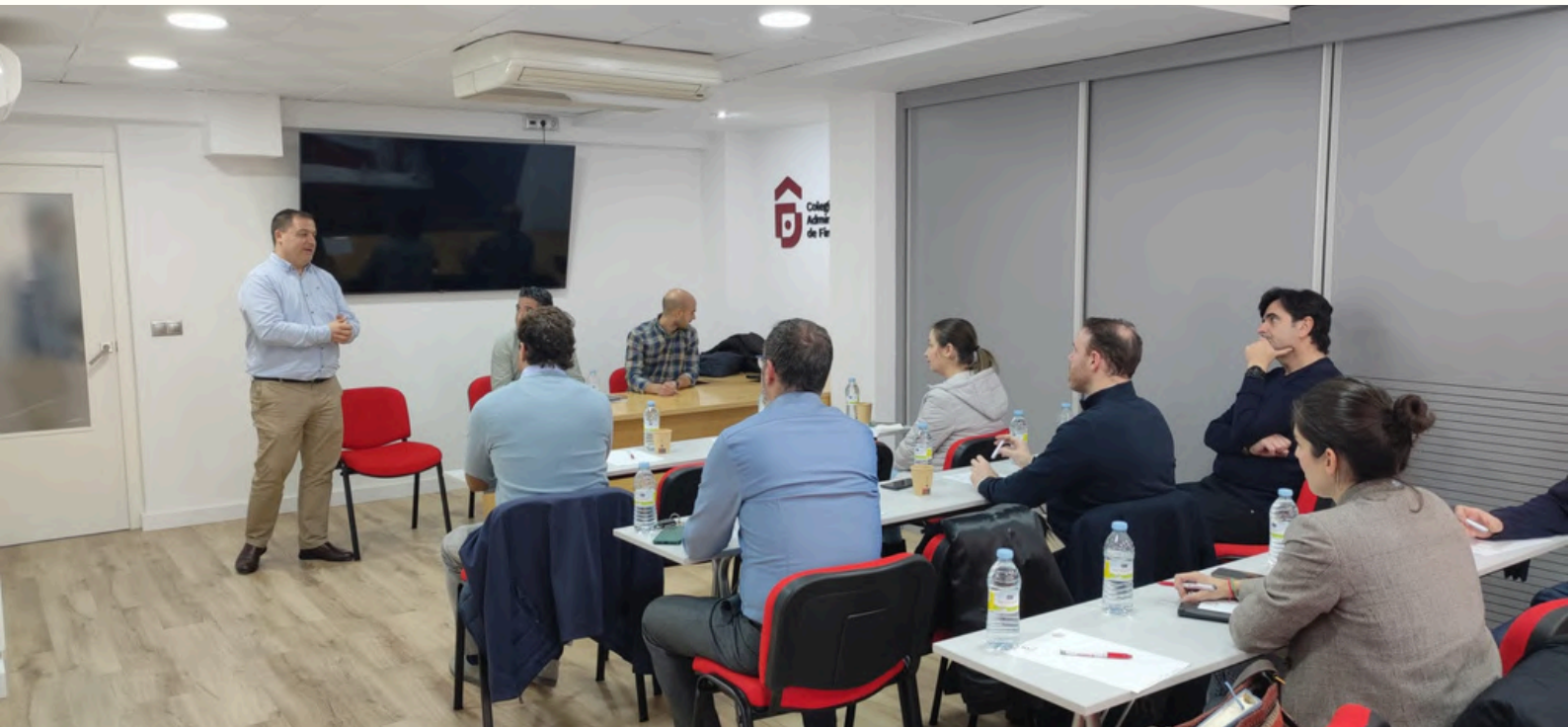
Imágenes de la charla informativa impartida en la sede colegial de Jaén

Jaén- El Colegio de Administradores de Fincas de Jaén organizó una charla informativa sobre los recientes cambios en la normativa de ascensores en comunidades de propietarios. Este evento tuvo como objetivo entre otros, aclarar las nuevas exigencias legales y su impacto en el mantenimiento y la seguridad de estos.