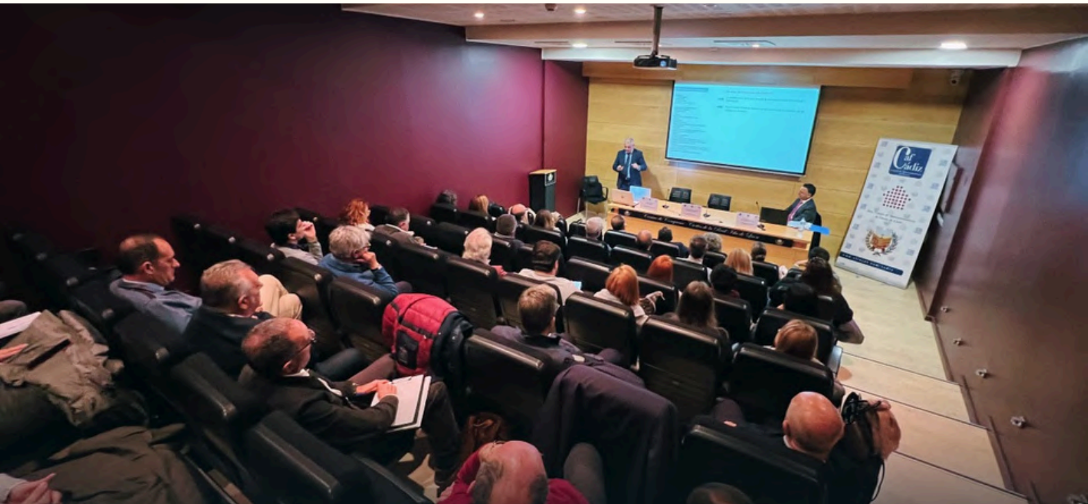
Imágenes de los asistentes a las jornadas

Cádiz - El pasado 7 de febrero, se celebró con gran éxito en San Fernando el Curso sobre Inspecciones Técnicas de Edificios Residenciales, un evento formativo clave para los Administradores de Fincas Colegiados. Durante la jornada, los asistentes tuvieron la oportunidad de profundizar en la normativa vigente, los procesos de inspección y las mejores prácticas para evaluar el estado de los edificios residenciales.