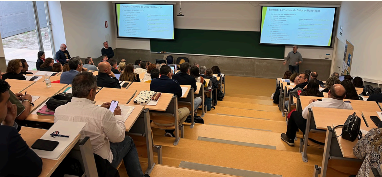
Imágenes de las sesiones de Innovacaf celebradas en Málaga