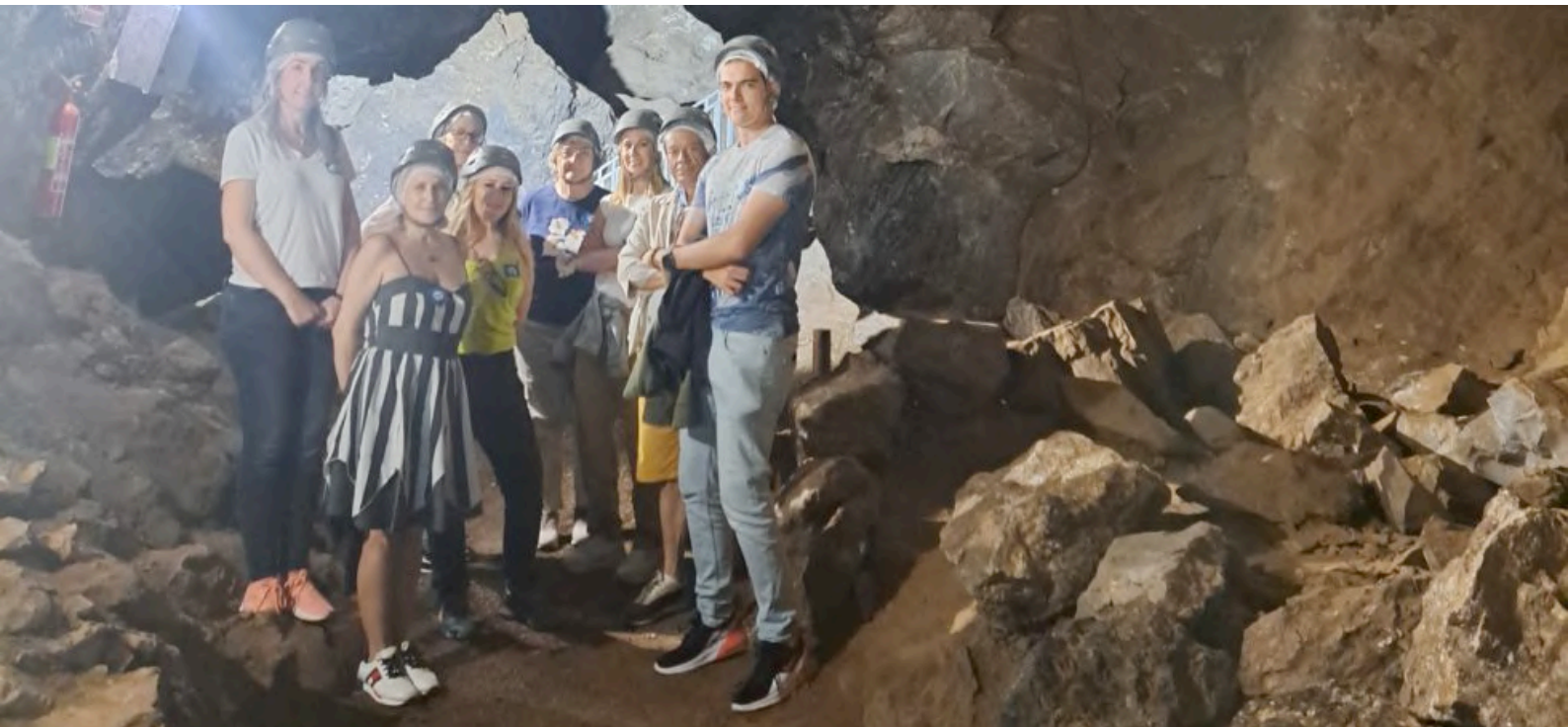
Miembros del Colegio de Administradores de Fincas de Almería durante la visita a la geoda de Pulpí

Almería - Los Administradores del colegio de Almería han visitado el pasado 31 de mayo, la cueva donde se ubica Geoda Gigante en el municipio almeriense de Pulpí disfrutando además de una visita guiada a la Mina Rica, donde se pudo comprobar el enorme esfuerzo realizado para hacer visitable este entorno minero convertido en un reclamo turístico de primer nivel.